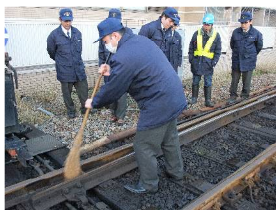
ポイント不密着を想定した教育訓練